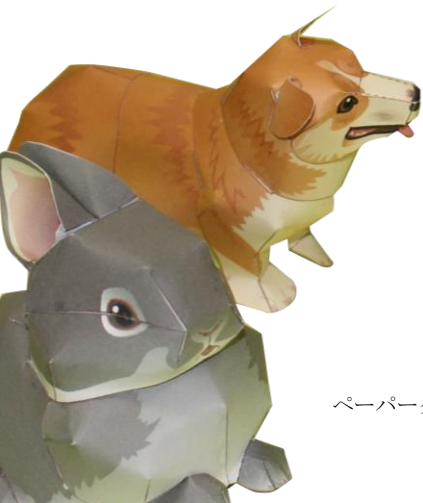
ペーパークラフト作品